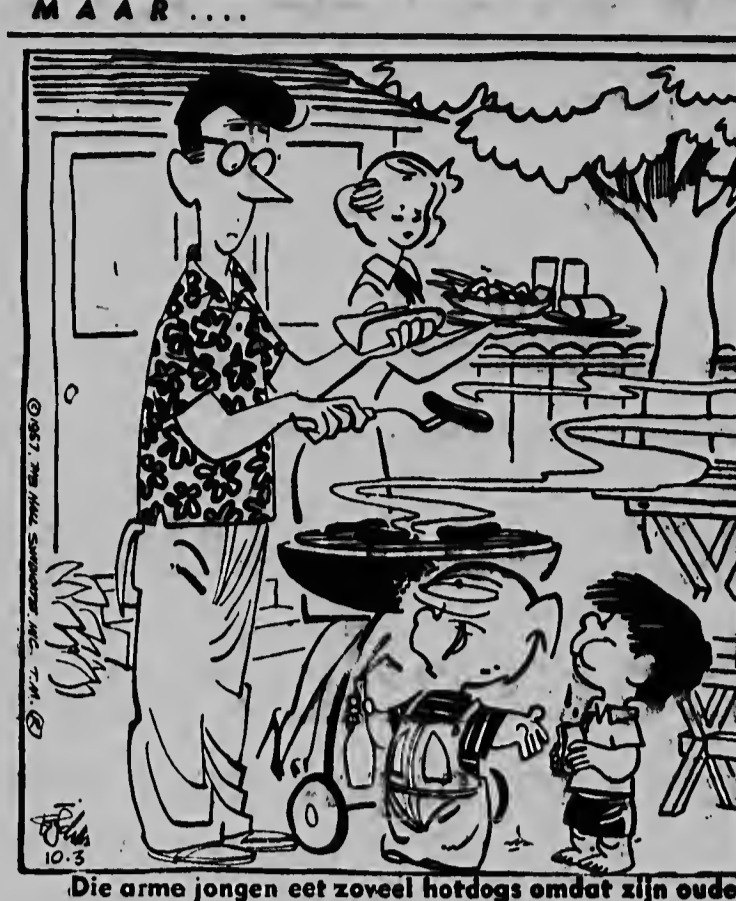
Die arme jongen eet zoveel hotdogs omdat zijn ouders vegetariërs zijn. E pobor mucha ai ta como asina tanto hot-dog, pasobra su majornan ta vegetariano. GEEN GEVAAR, N.E.N. IS DAAR...